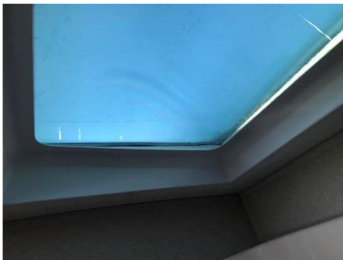
Exemple de puits de lumière fissuré

ÉTAPE 8: RÉCLAMEZ CONFORMÉMENT AU CODE DE RÉPARATION.