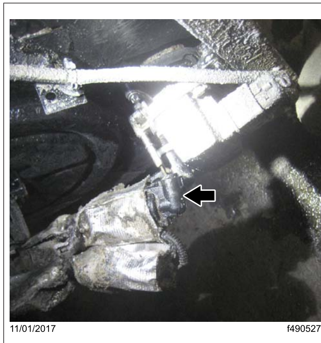
Fig. 1, Conduite de DEF déconnectée