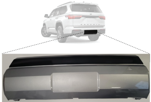
Cubierta del enganche para el remolque (Deseche después de retirar)