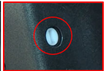
Above: Driver side door is pictured; passenger side door is similar