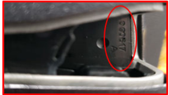
Above: Driver side door is pictured; passenger side door is similar