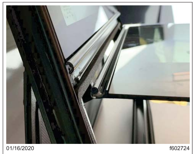
Fig. 2, Ventana fuera de la bisagra