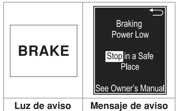
Luz de aviso

La reparación tomará aproximadamente dos horas. Sin embargo, dependiendo del horario de trabajo del concesionario, es posible que necesiten su vehículo por más tiempo.