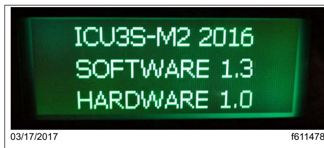
Fig. 1, La pantalla de la ICU3S muestra la versión de software 1.3 (correcta)

Si el nivel de software es inferior a 1.3, continúe con el siguiente paso.