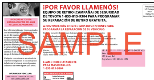
Sample post card – for reference purposes only.

The Outreach program is scheduled to run mid-June, 2015, through October, 2015. However, depending upon customer response to the program and the completion rate of the remedy repairs, these dates could change.